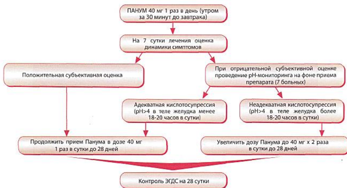
Рис. 1. Дизайн исследования

Согласно критериям включения в исследовании участвовало 30 больных, некоторые общие сведения о которых приведены в табл. 1.